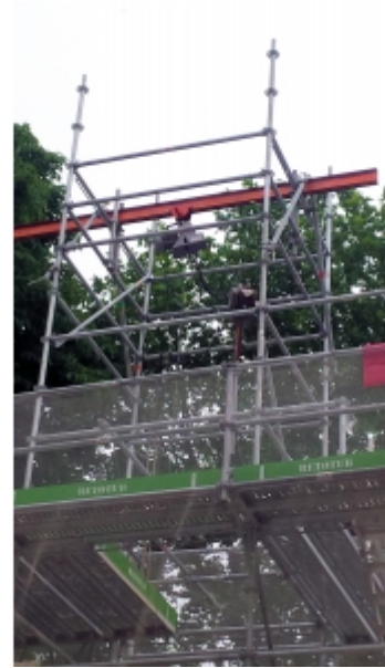
Installation sur fer fixée sur échafaudage