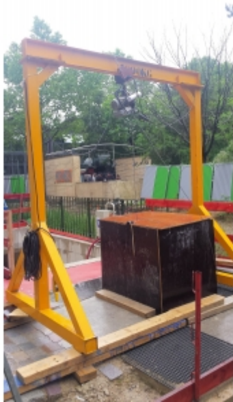
Installation sur portique