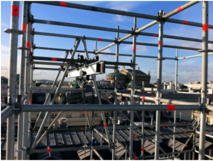
Installation sur fer fixée sur échafaudage