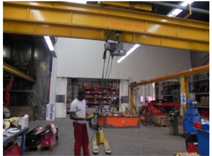
Installation sur un portique d'atelier