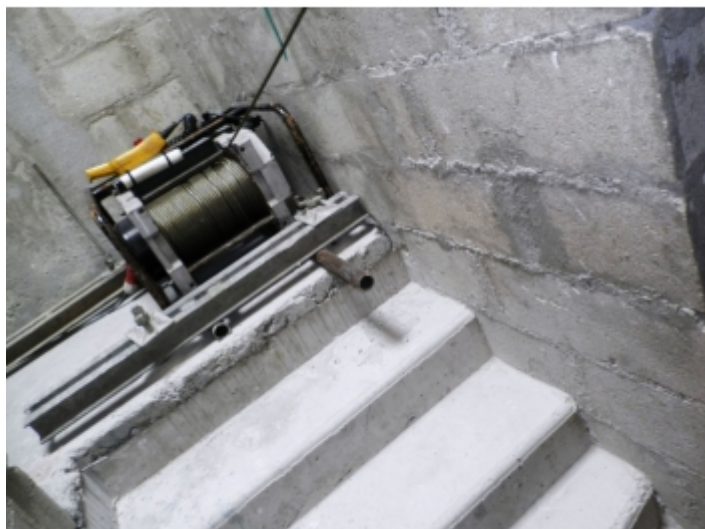
Fixation par ancrage