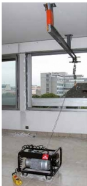
Installation avec une poulie de renvoi sur fer