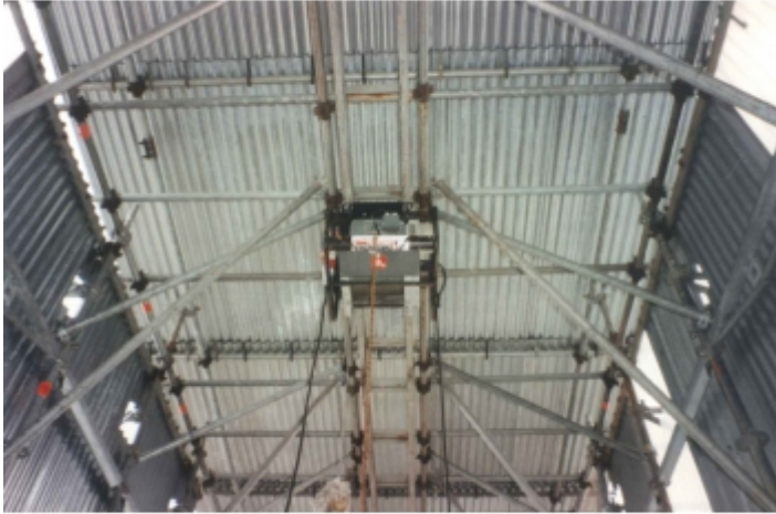
Fixation en hauteur