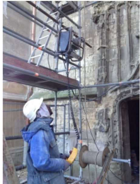
Fixation sur échafaudage