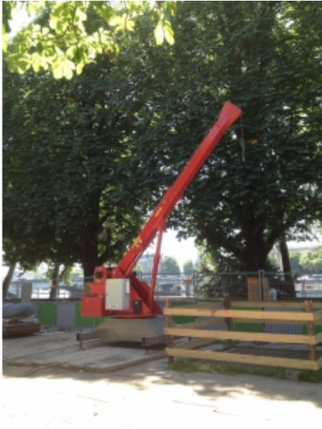
Travaux de réseaux