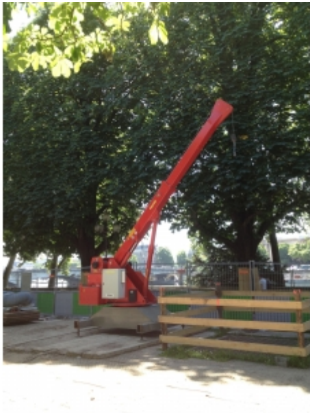
Travaux de réseaux