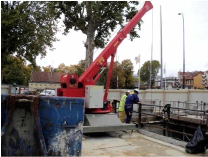
Travaux de réseaux