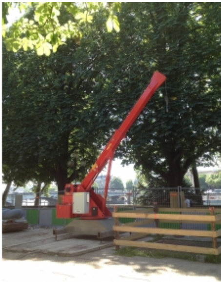
Travaux de réseaux