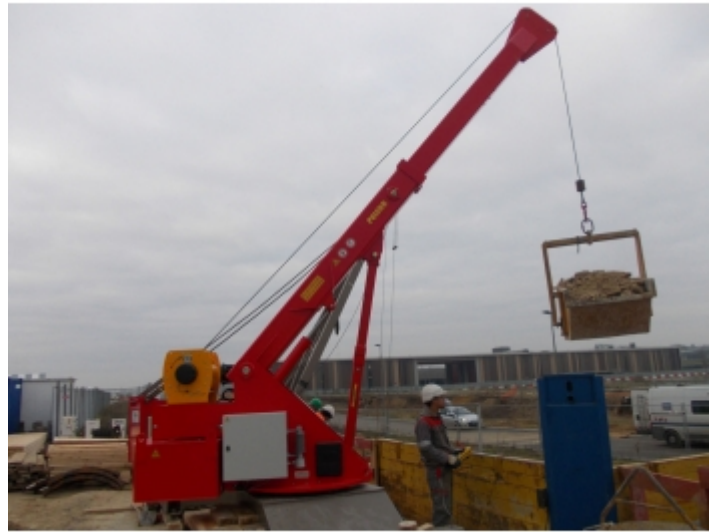
Travaux de réseaux