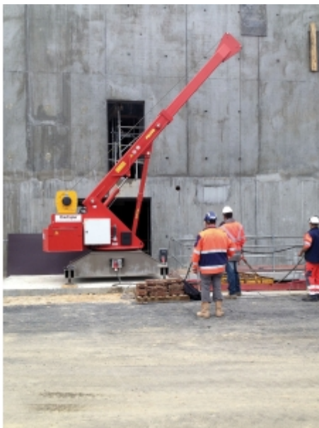
Travaux de réseaux