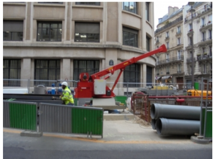
Travaux de réseaux