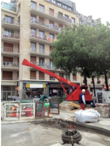
Travaux de réseaux