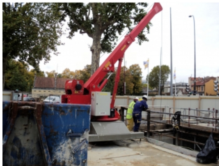
Travaux de réseaux