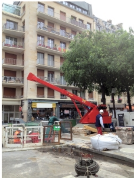
Travaux de réseaux