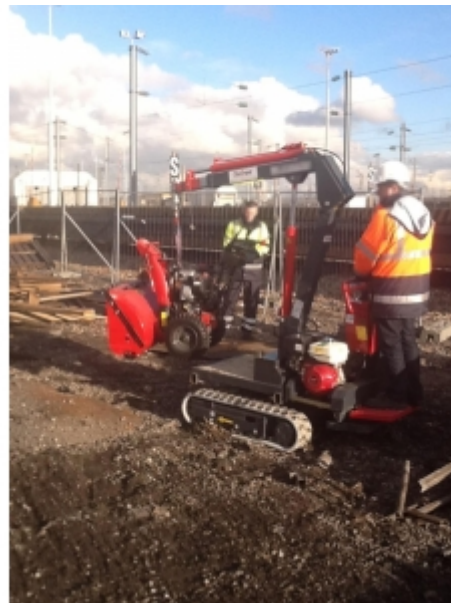
Déchargement d'un matériel