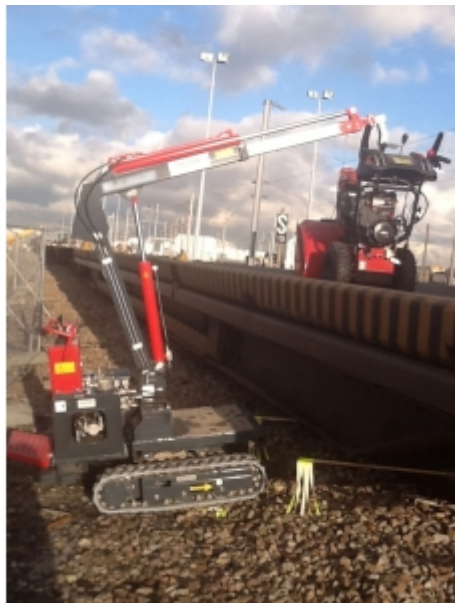
Déchargement d'un matériel