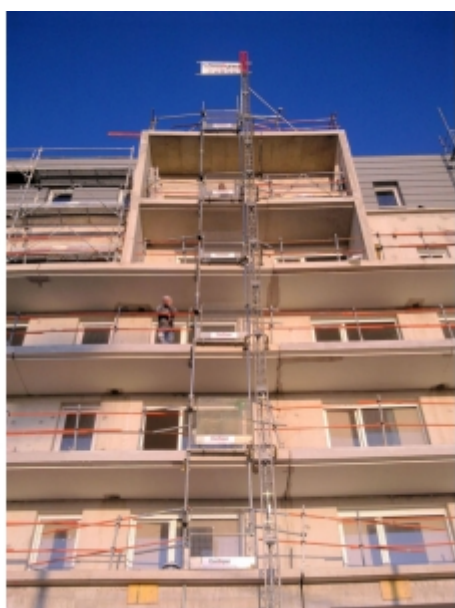
Portes basculantes installées pour desservir les étages