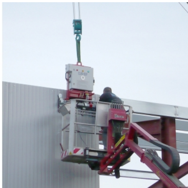
Palonnier à ventouses bardage cleo 300