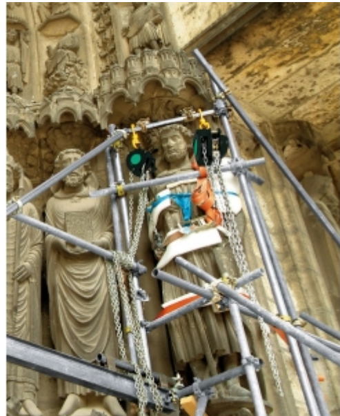
Installation sur échafaudage