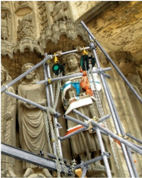
Installation sur échafaudage