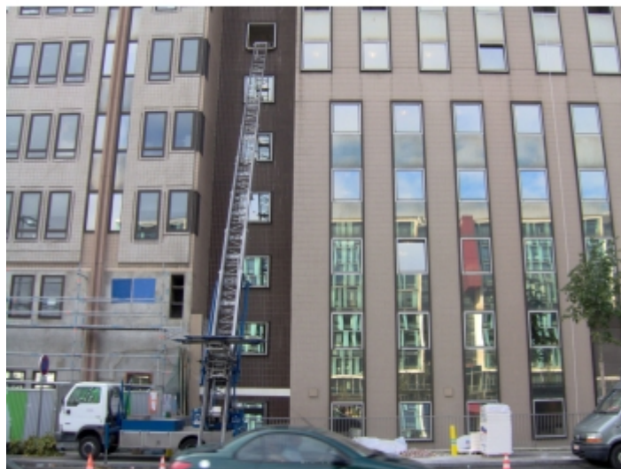
évacuation de meubles