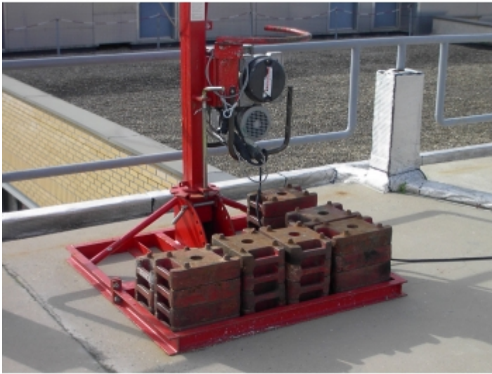
Lestage d'une grue gs250