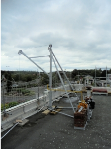
Installation en terrasse d'un immeuble