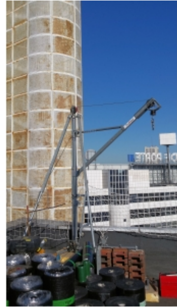
Installation en terrasse d'un immeuble