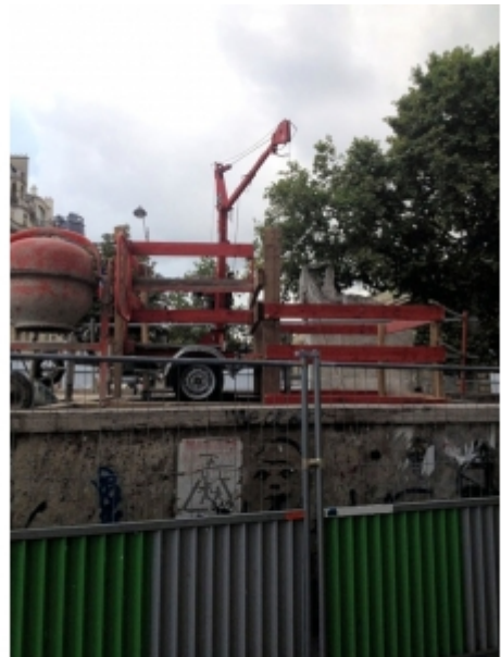
Travaux de réseaux