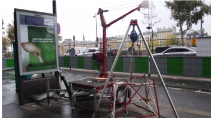
Travaux de réseaux