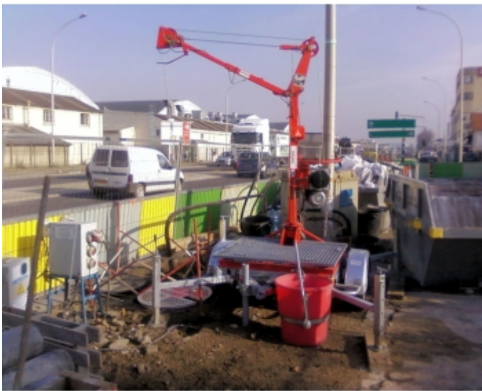
Travaux de réseaux