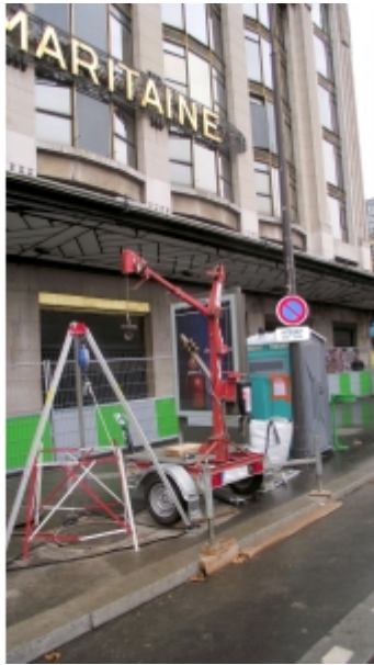
Travaux de réseaux