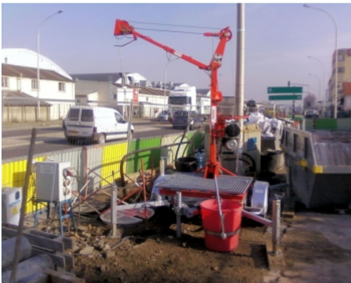
Travaux de réseaux