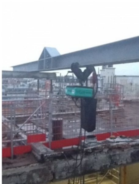
Installation sur fer avec un palan électrique