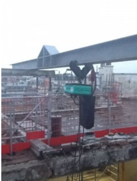
Installation sur fer avec un palan électrique