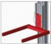
Code A23/001 : Fourche pour élévateur

DIMENSION DES FOURCHES : Espacement des fourches : 650/750 mm – Longueur : 710 mm