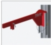
Code A23/002 : Potence pour élévateur