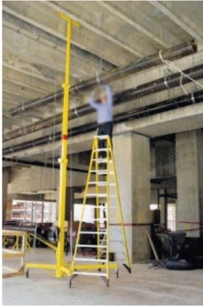
Levage de charges