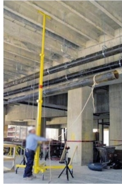
Levage de charges