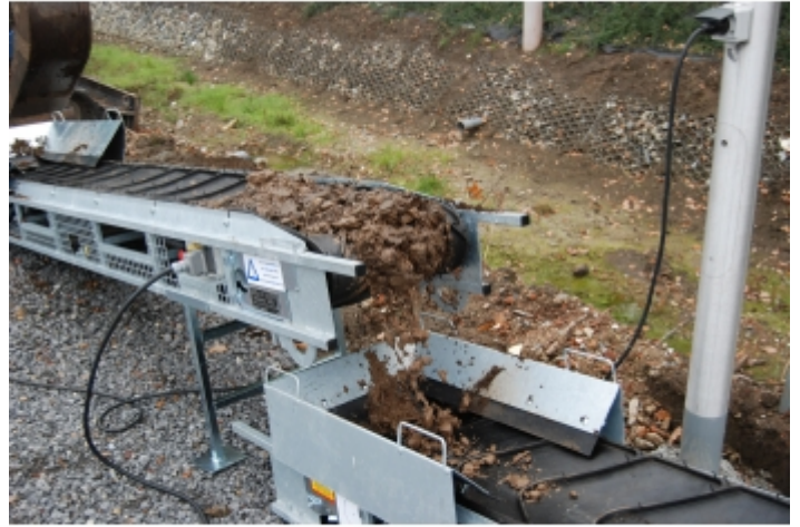
évacuation de gravât