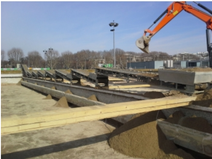
évacuation de gravât