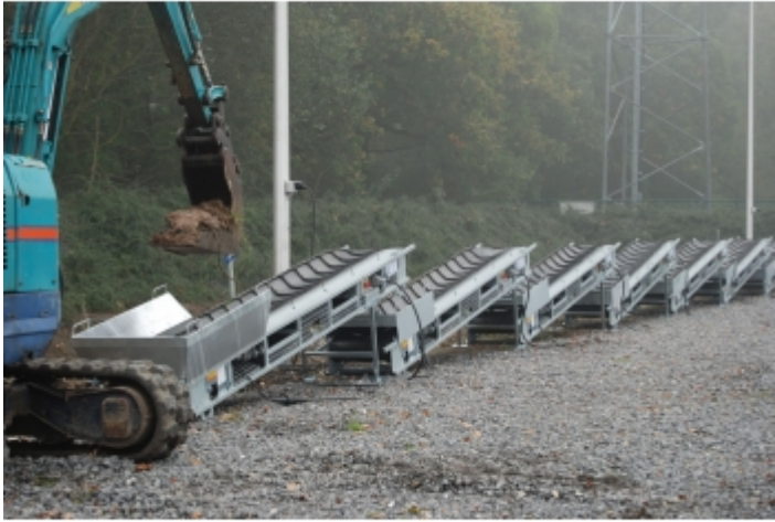
évacuation de gravât