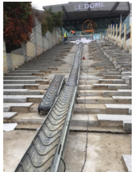
évacuation de gravât