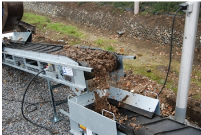
évacuation de gravât