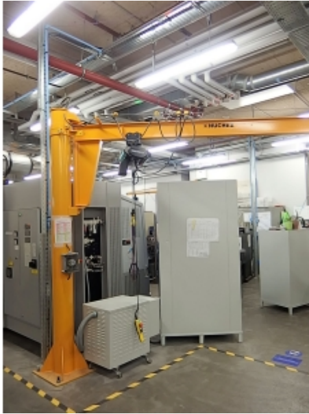
Installation sur portique avec un palan électrique