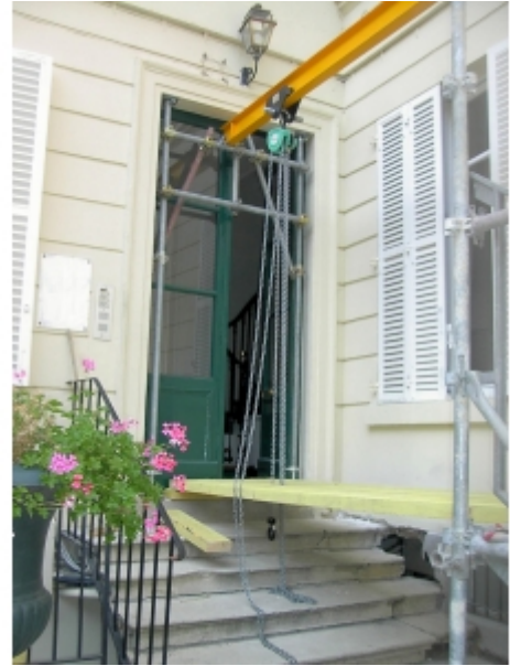
Installation sur fer avec un palan manuel