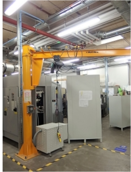
Installation sur portique avec un palan électrique