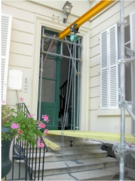
Installation sur fer avec un palan manuel