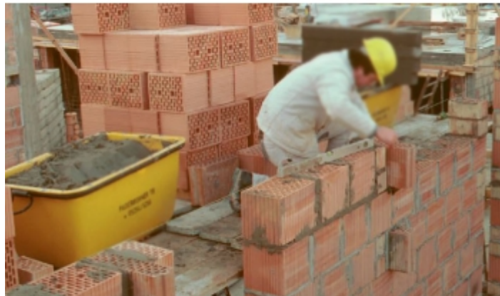
Manutention de mortier sur chantier