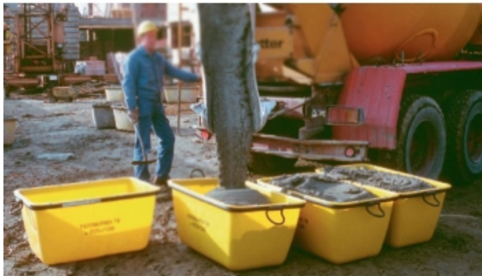
Manutention de mortier sur chantier